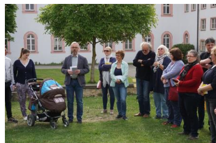
Na nádvoří kláštera Rohr