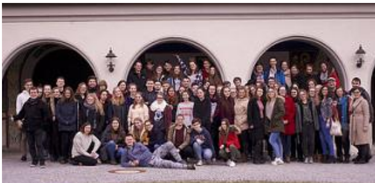
Skupinové foto před klášteřem v Niederalteichu

Vše začalo ve čtvrtek 28. března, když jsme se